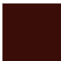
ACAJOU Ref. 0043091