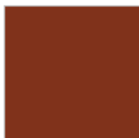
MARRON CLAIR Ref. 0002038