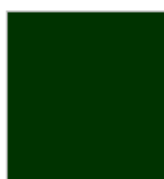
VERT FONCE Ref. 0803206