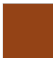
FAUVE Ref. 0803190