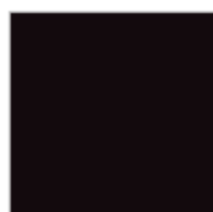
BRUN SANGLIER Ref. 0043329