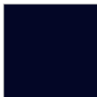
BLEU MARINE Ref. 000208