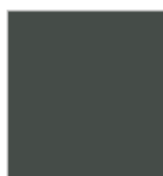
GRIS Ref. 0803145