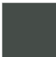
GRIS Ref. 0043145