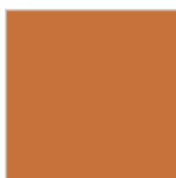
CUIR NATUREL Ref. 0043398