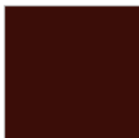
ACAJOU Ref. 0002098