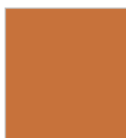
CUIR NATUREL Ref. 0803398