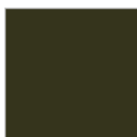
KAKI Ref. 0043282