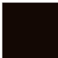
MARRON FONCE Ref. 0002050