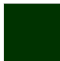
VERT FONCE Ref. 0043208