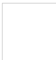
BLANC Ref. 0803213