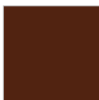
NOISETTE Ref. 0043381