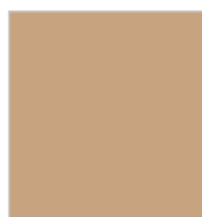
BEIGE Ref. 0803169