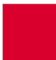
ROUGE Ref. 0803114