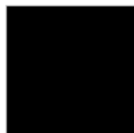
NOIR Ref. 0002012