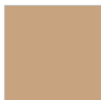
BEIGE Ref. 0043189