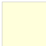
INCOLORE Ref. 0002029